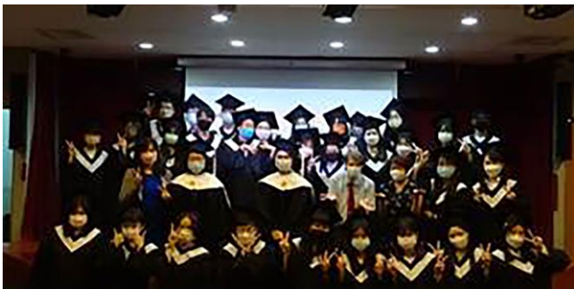
大學部畢業生與師長合影

在典禮的過程中也有歡笑也有淚水，來自校長、院長、市長，以及本系師長們的話語字字都帶著祝福及力量，希望可以傳遞至畢業生並給予他們希望與勇氣。師長們的致詞也句句盛載著重量，彷彿是為了畢業生在未來的迷霧中預先給予的地圖。相信畢業生已經和當初剛入學的自己截然不同，大學生活也許不是每件事都非常完美，但相信畢業生們經過英語教學系四年的淬鍊後，都能走上屬於自己的康莊大道。