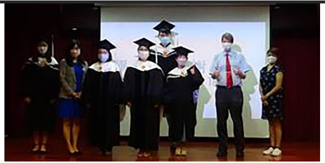
碩士班畢業生與師長合影