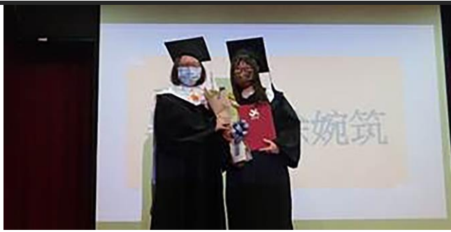
畢業生領取畢業證書