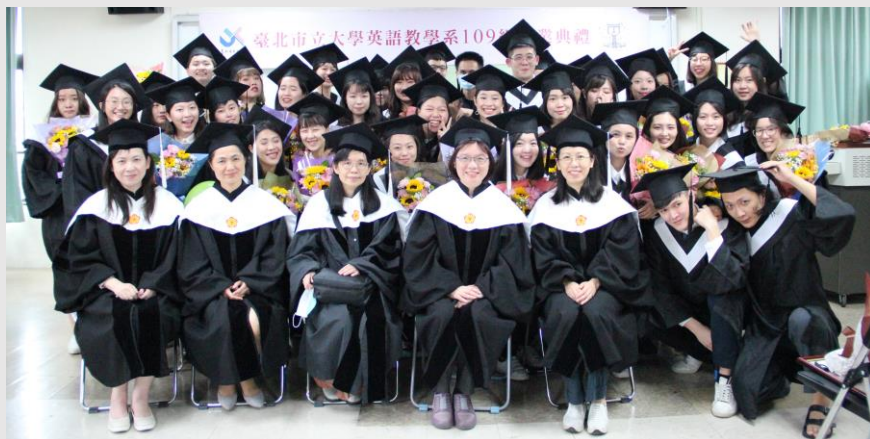
大學部畢業生與師長合影