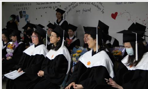
感謝師長們的出席