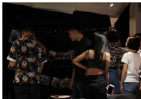
欣賞過去的照片回憶