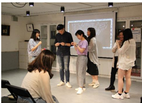
有趣的遊戲懲罰時間