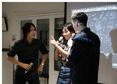
最精彩的歌舞劇表演

滿結束了！英 To The Unknown 為這次活動的名稱，象徵著未來學長姊都即將邁入一個未知的世界。也因應疫情，這次的送舊特別選在校外的〈華園文創〉所舉行。活動股用心準備了好吃的點心和飲料讓大家可以隨時保持滿滿的體力。還有精美客製，屬於英教系 109 級獨特的禮物送給學長姐們。當天的表演更是讓人印象深刻，Hardcore 的饒舌風格、灑狗血的歌舞劇風格、清新脫俗的歌唱以及英教系最佳重唱的封麥演唱會。還有最最最美的拍照牆和場佈，利用了各式各樣的造型汽球和英文字母，擺設出最值得紀念的一刻，讓各位勝似名模的學長姐們