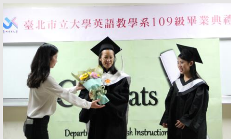
畢業生領取畢業花束