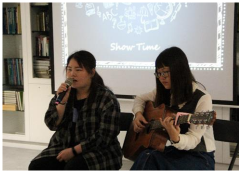
學弟妹獻上祝福表演