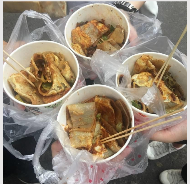
圖五：南門外香和肉餅打滷麵

此外，在華師的每個出入門外都有好吃的店，南門的香河肉餅，雖然是賣餅的但我總是吃打滷麵；東南門的烤冷面和肉夾饅，吃完之後也聽同學說是華師著名美食；東門外虎泉有更多選擇，饞嘴花甲米線、仙豆糕、矮子鍋盔都是我常吃的。最後還有離我最近的西門，一品鮮的水餃與炒飯也成為我筆記中華師美食的一部份。