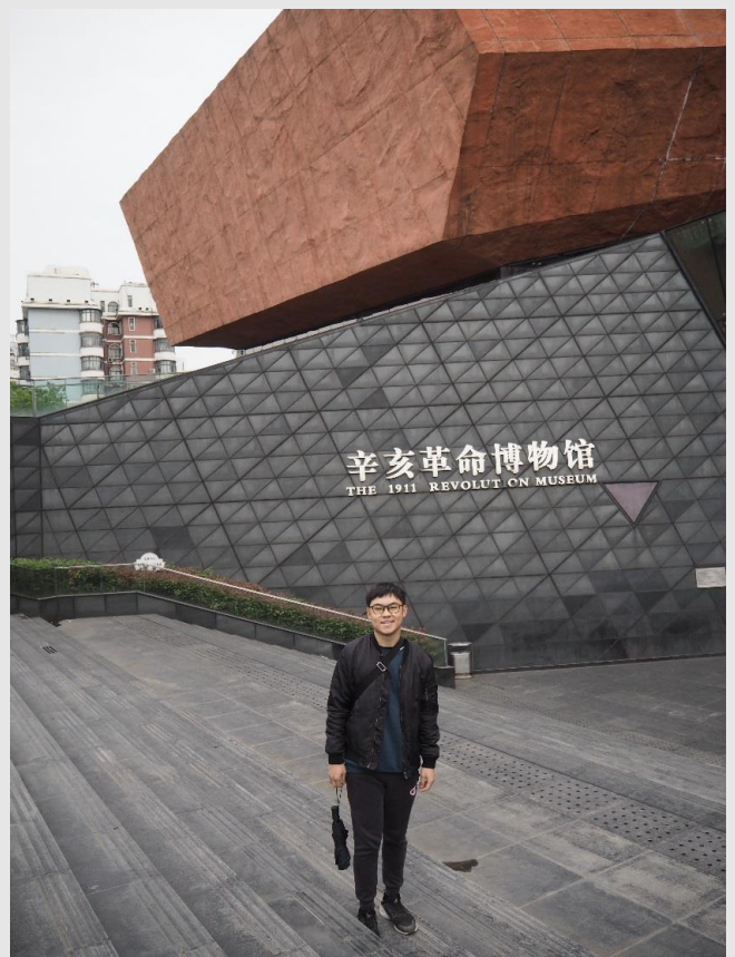
圖八：辛亥革命博物館