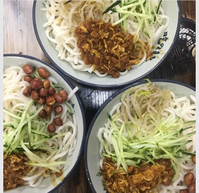
圖四：東南門烤冷麵

當然不僅是桂香園，還有博雅園的黃燜雞米飯、滿江紅裡面的華師滷菜都是西區中我常吃的一些店。至於東區有東一、東二、學子三個食堂，東一食堂二樓的川南牛肉麵很好吃，東二食堂二樓的山城菜館是想在學校吃合菜的好去處，還有學子餐廳大家會推薦那家鐵板飯，不過我倒沒有非常喜歡；相反我比較常吃旁邊那家鴨腿飯，它的鴨腿和雞排飯都好吃，在用餐時段也總是充滿著人。說到東區還有一家益和堂飲料店，是華師著名的飲料店，因為我總在華師校園的每一處都會看到有人拿著一杯。烤奶是它家的招牌，但對我來說它好甜，就算點了無糖還是甜，不過它確實好喝，如果去東區基本上都會帶上一杯回宿舍，畢竟從國交走到東區至少也要個 20 分鐘。