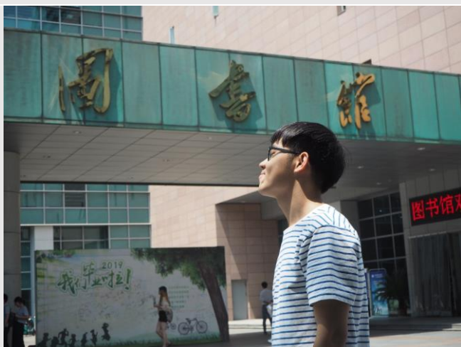
圖三：華師圖書館與我

先從魏晉南北朝史開始說起好了，在台灣我也上過這門課，來這邊其實很多專業課我都上過了回到台灣其實並不能抵學分，但是總想要體會在上課內容、方式與課程著重的地方有何差異，這也是我一開始來這邊學習最主要的目的。在上魏晉南北朝這段中國史上可以說是黑暗時期，或者是中國的中古時代，老師用 PPT 講述一些重要的歷史議題，特別拿出來討論，針對歷史發展與歷史事件也僅提出重要之處，其餘的必須看老師要求的考試用書。另外課程中還進行了兩次小組報告，這是我覺得比較新奇的點。在台灣我上這種類型的斷代史幾乎不會有小組報告，在華師老師要我們針對一個大方向的主題去找材料、自行設想題目來分享，這樣在聽同學們匯報的時候可以聆聽到各種有關魏晉南北朝時期議題，這就代表同學們必須嚴謹蒐集資料，找出方向來設想可能的題目，最後不管材料能夠佐證或者否定你的觀點，都會帶給你新的視角，就好像在寫一篇學術論文一樣，但不同之處在於這是小組的報告，必須大家一起討論。而台灣在斷代史方面通常以考試為主。