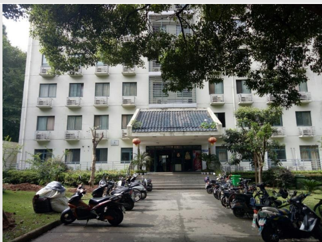
圖六：國交六棟外貌

另外在國交要買熱水卡才有熱水洗澡、要買洗衣卡才能洗衣服，和我在台灣不同，我們熱水通常免費，洗衣服都投幣。除此之外還有門卡，才剛進宿舍我就有了一堆卡，瞬間覺得自己負擔很重，畢竟這些卡都有押金。