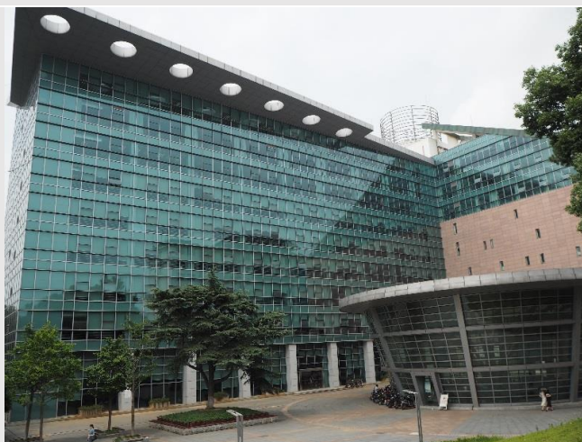
圖一：華師北門(正門)

華師因為校園大，食堂也多，華師裡面就有 5~6 家食堂，食堂可能還分成有兩樓的有三樓的，不禁讓我想起我在北市大的學餐只有 5~6 家店可以選擇，差別真的太大。食堂店家很多，賣的食物也是玲瓏滿目，武漢位於九省通衢，華師校園食堂充滿來自各地的美食，就算每天都換家吃，也不太可能把每一家店的每一道特色餐點吃過一次，很高興我在這裡每天都在嘗試新的事物，其中一個絕對是食物，再來是吃辣。雖然知道武漢這一帶都吃很辣，剛開始還不敢嘗試，甚至有些菜不加辣對他們來說非常奇怪，但漸漸地好像也習慣這種辣，充滿著花椒味，非常香。