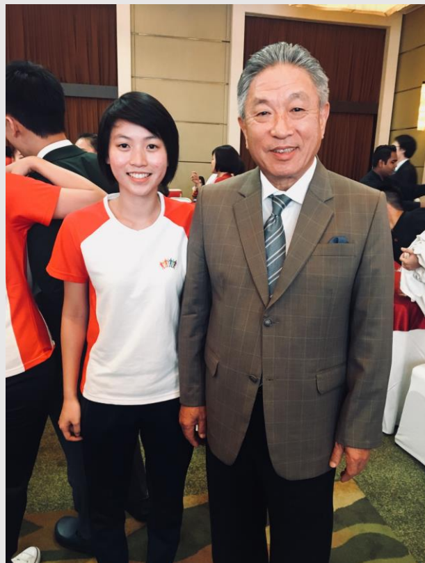
與駐印田中光大使合照