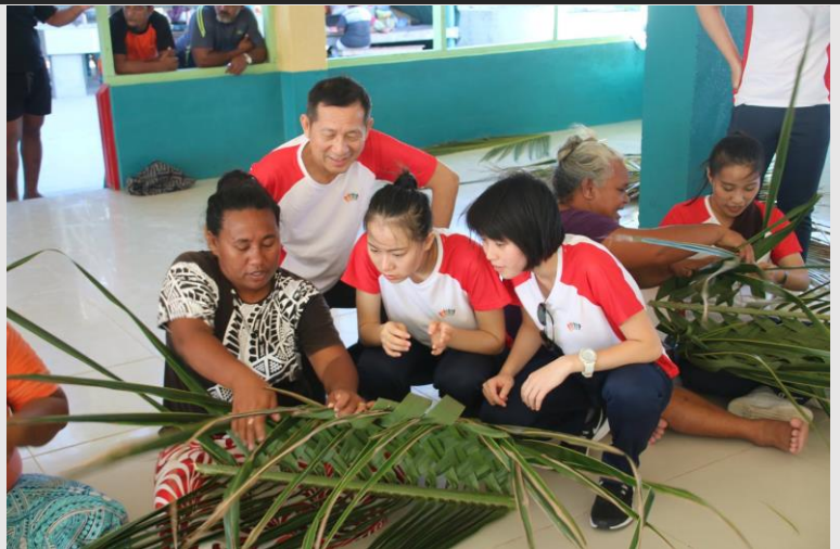
與吐國島嶼青年團領袖及團員進行傳統文化交流

一日志工服務與學習是我們前往拯救兒童組織（BBA）的目的地，在這裡與身世坎坷的孩子們一天相處。他們可能被誘拐、被擄、以超低價向不識字的父母買去做粗工。