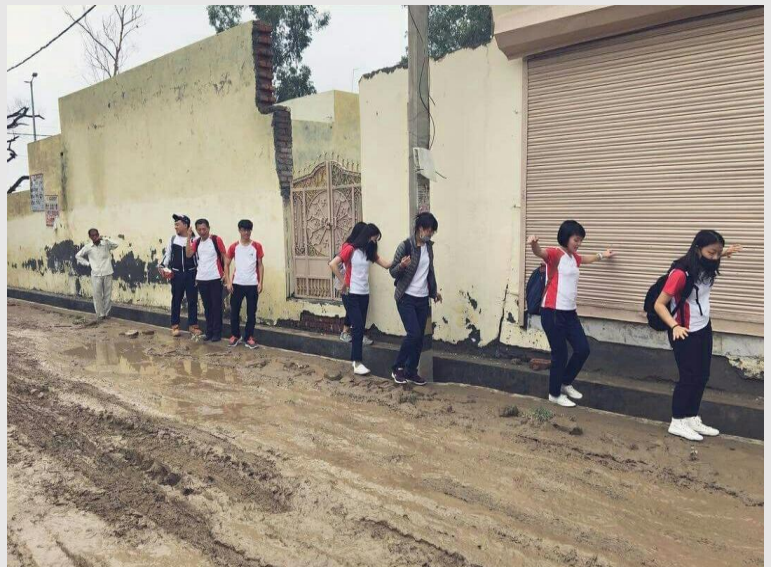
印度拯救童年行動 NGO 組織一日志工路上

新德里的最後一夜也是台灣之夜最終場，我臨危受命與另位同學為當晚主持人，現場觀眾熱情如火，報以歡呼與尖叫，汗水在掌聲中得到回報，也為任務劃下圓滿的休止符。