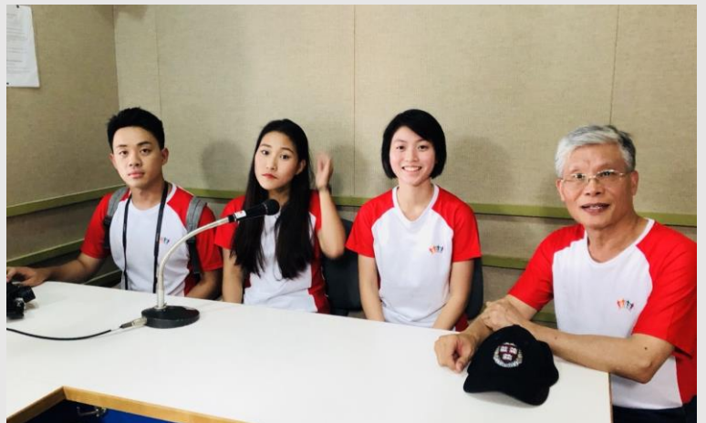
吐國廣播公司受訪