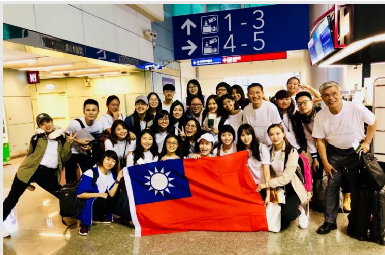
出發前 桃園國際機場 大合照