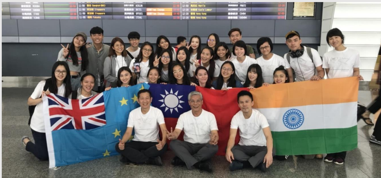
國際組織亞非農村發展組織 AARDO 全體合影

背負的使命，現在告一段落，未來正要開始，我們不忘記自己的責任，會繼續將臺灣青年的熱情與活力傳播給世界。第一次體悟，年輕人草莓族也可以為國家出點力，做點事，感覺自信又驕傲，雖然力量很弱很小，但是在一生在記憶裡，這段旅程讓我們和國家更靠近更親密。