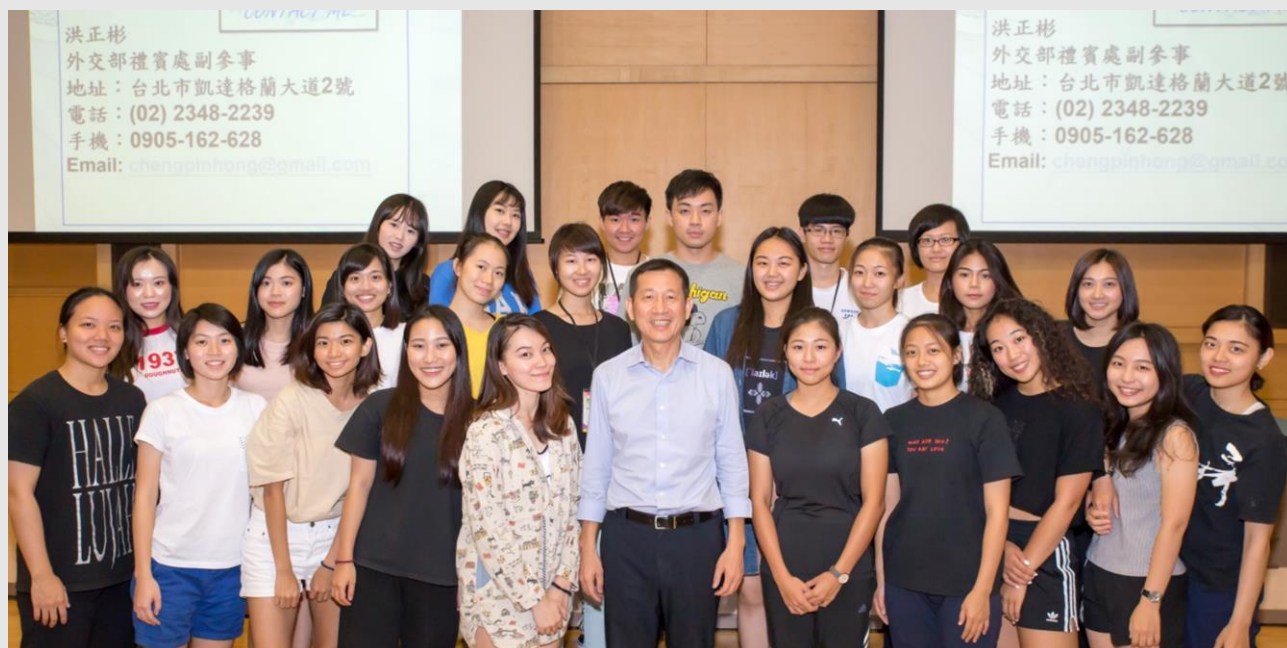
吐瓦魯印度團與副團長合影

這次的任務，帶我到一生可能都不會去的地方--吐瓦魯。帶我歷經和長官的美好相處，他們像鄰居小明的爸爸，親切沒有架子。我們寫下了人生的新頁，渡過了不平凡的暑假，視野被打開，麻雀成鳳凰，一介平民變大使，四面八方來的英文高手和功夫了得的青年，彼此有了真摯的情感，因為我們信仰相同，要讓世界，看見臺灣認識臺灣。